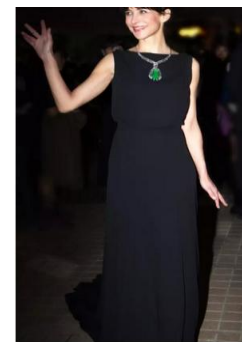
苏菲·玛索 Sophie Marceau 佩戴 TTF 高级定制翡翠《雅鲁藏布》演绎东西方文化融合之美